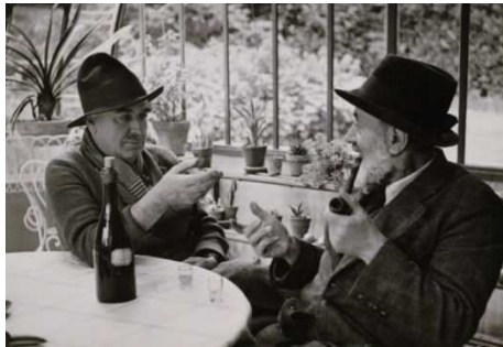
Dunoyer avec Caudour à Chaville Robert Doisneau – 1951