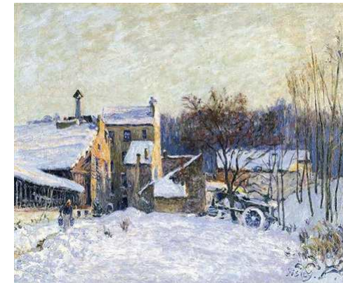
Alfred Sisley Cour de ferme à Chaville- 1879