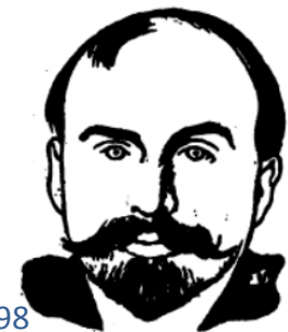
Marcel Schwob Felix Valloton - 1898