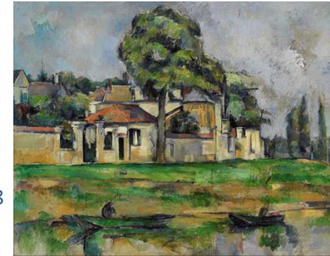
Paul Cézanne Bord de Marne. 1888