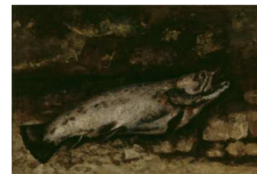
La Truite Courbet