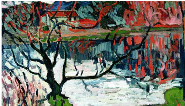
Maurice de Vlaminck Chaville : Etang d'Ursine - 1905