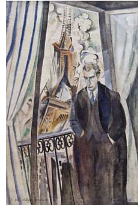
Philippe Soupault Robert Delaunay - 1922

Je t'embrasse de tout cœur Ta petite vise qui t'aime de tout son cœur