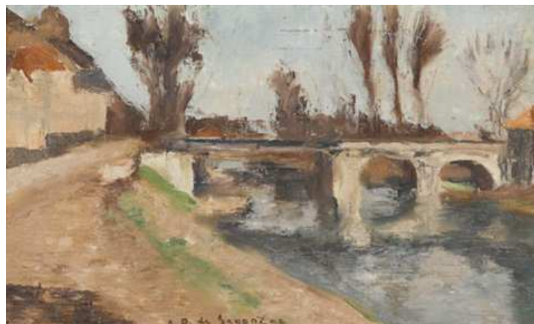
Le pont à Chaville