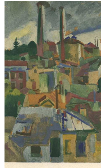
Robert Delaunay : Usine à Chaville

"Quand j'ai connu Robert, il faisait beaucoup d'études de plantes. C'était un amoureux des fleurs. La vraie rencontre, ce fut à Chaville, pendant les vacances. Je voyais Robert peindre des fleurs dans le jardin."