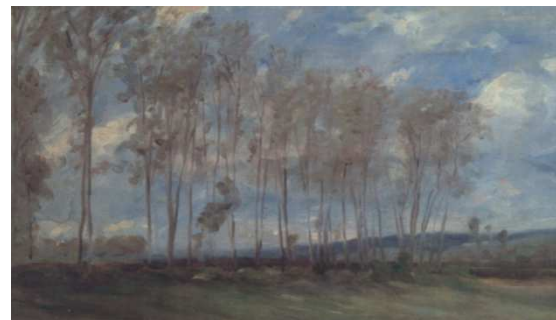
Paul Huet: La lisière des étangs à Chaville - 1865

Paul Huet achète un chalet à Chaville en 1863